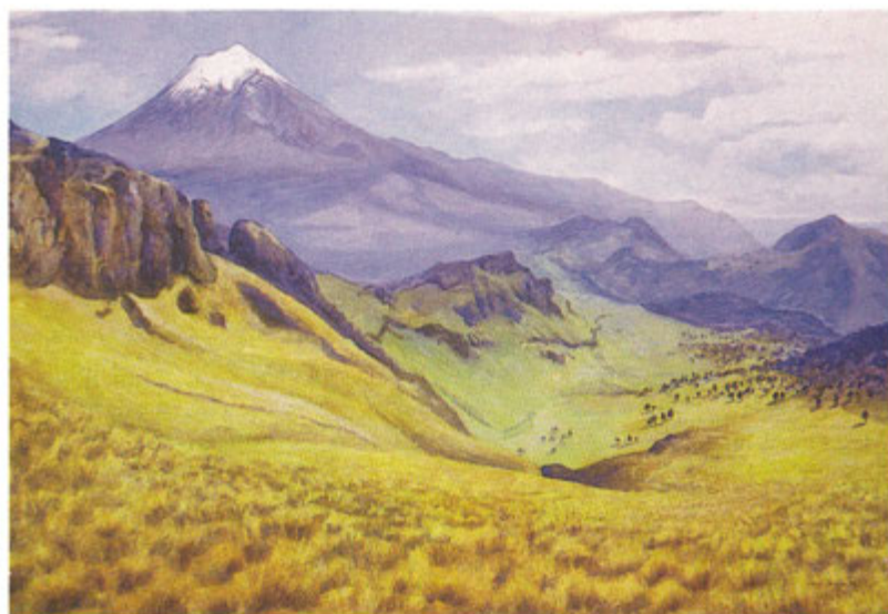
El crater del Teuhtli (cat. 10)