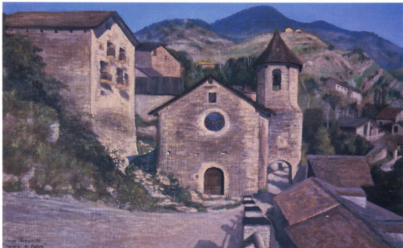
Església de St. Roc, Farrera, Oleofino 42 x 70 cm 1997.

El Proyecto Llum del Pirineu Català (Luz del Pirineo Catalán), fue realizado en los alrededores de Farrera de Pallars, que se encuentra en Cataluña, España; abarcando parte del verano, el otoño y el comienzo del invierno.