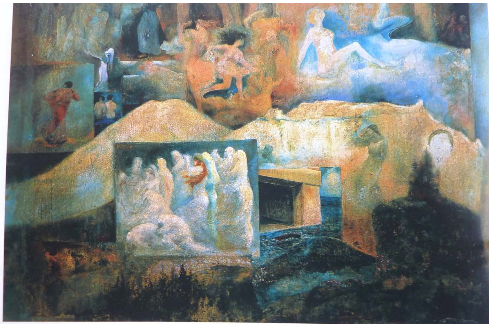
Joaquín Clausell. Detalle de su estudio . Óleo sobre yeso. 100 x 120 cm. Museo de la Ciudad de México. Páginas 14 y 15: Jorge Obregón. El Popocatepetl desde el Teyotl . 2000. Temple y óleo sobre lino y madera. 100 x 205 cm. Colección del autor.